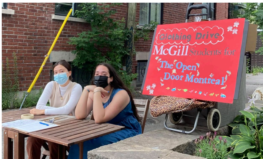
Bénévoles du groupe « McGill Students for The Open Door Montreal »